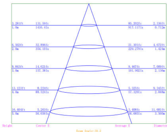
Illuminance Distance Curve: